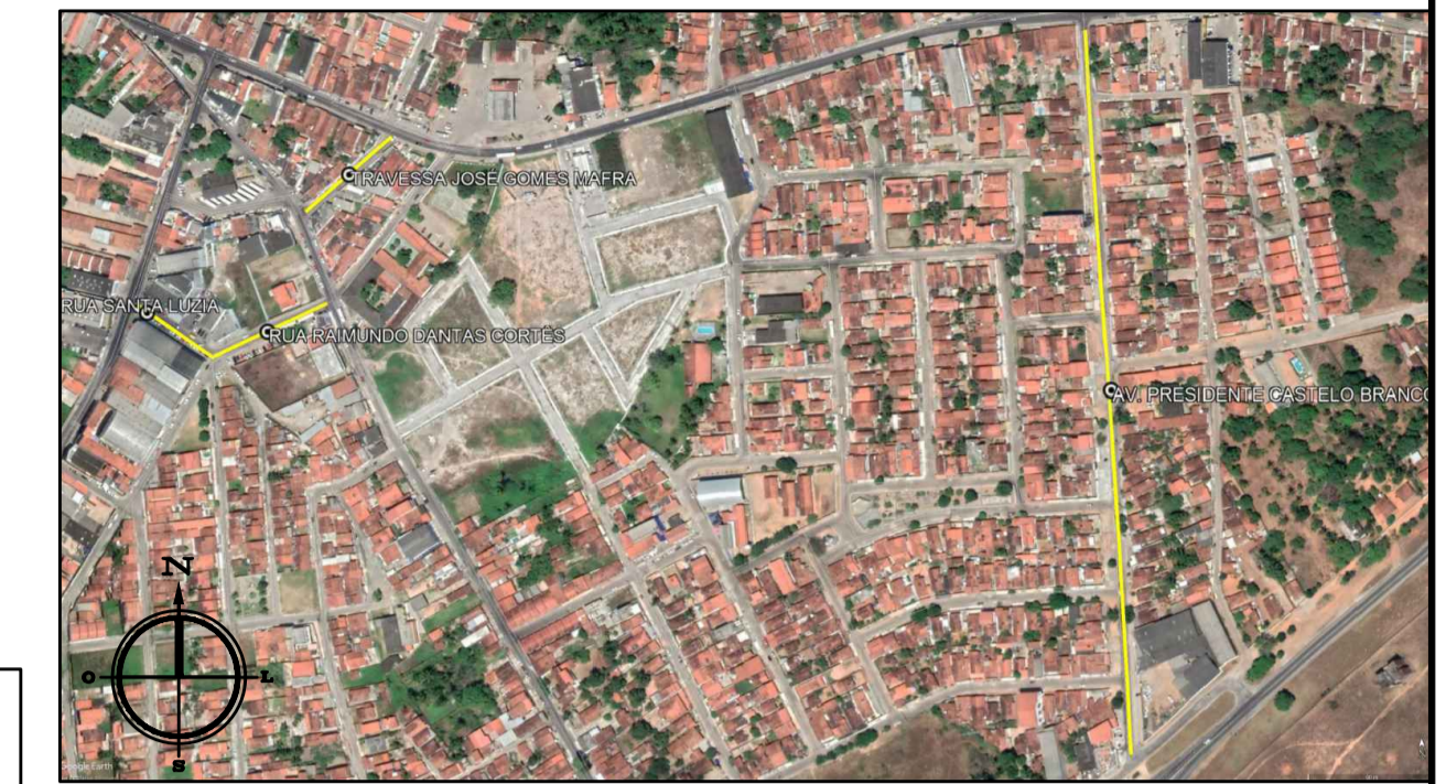
PLANTA DE LOCALIZAÇÃO Sem Escala