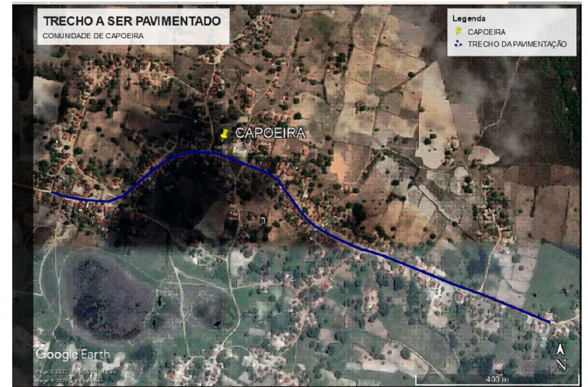
PLANTA DE LOCALIZAÇÃO Sem Escala

Obs: Dimensão e especificações elaborado de acordo com o manual de "sinalização horizontal" Vol. IV, CONTRAN/DENATRAN, publicado por meio da resolução Nº 236, de 11 de Maio de 2007.