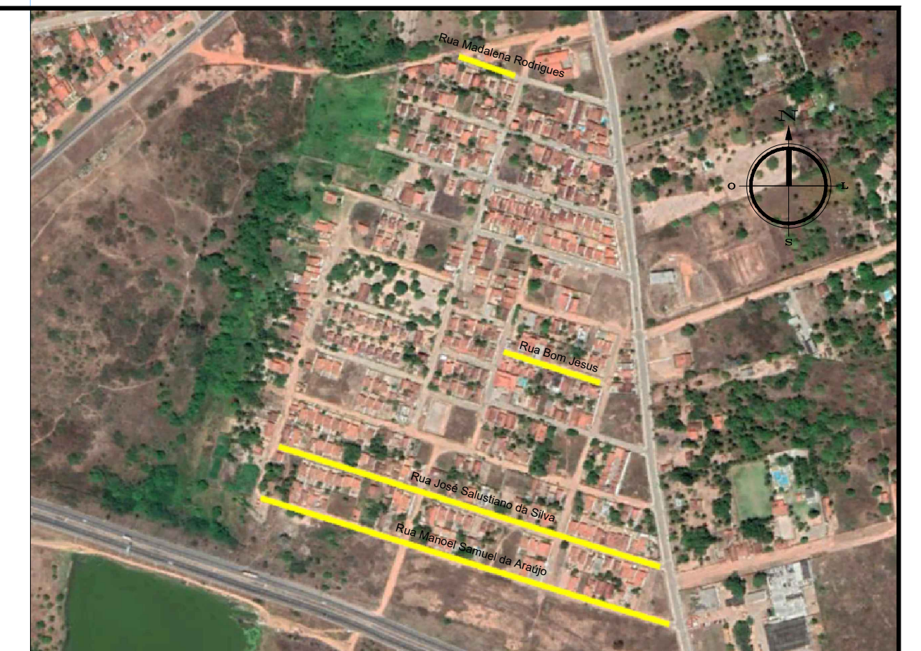
PLANTA DE LOCALIZAÇÃO Sem Escala